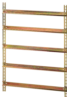
Raam samengesteld met 1 set verticale profielsteunen ref. 361 55 en dwarssteunen ref. 367 83