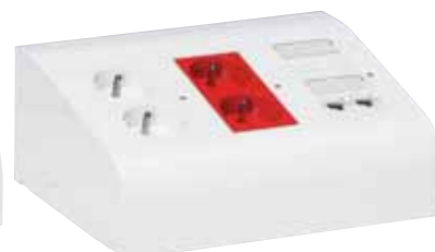
317 49 Uitgerust met afzonderlijk te bestellen contactdozen