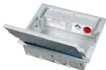
893 03 uitgerust met contactdozen, afzonderlijk te bestellen