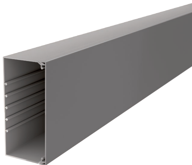
Kanaal en deksel met bodemperforatie.