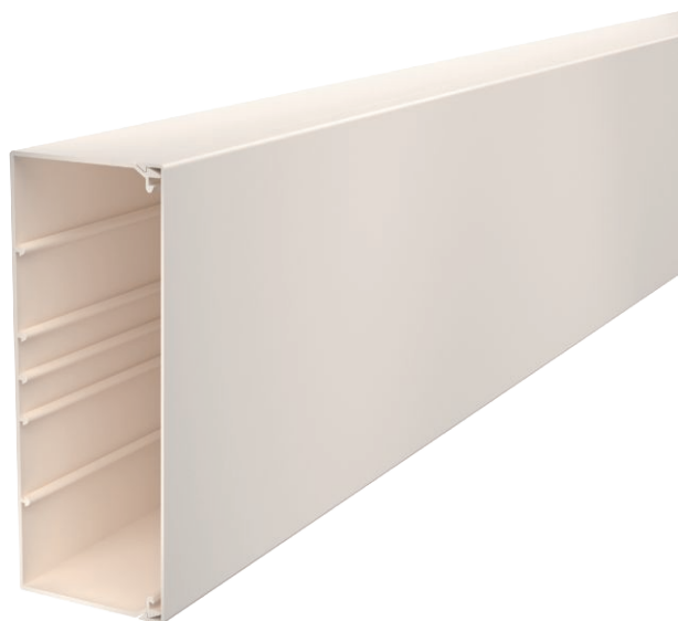
Kanaal en deksel met bodemperforatie.