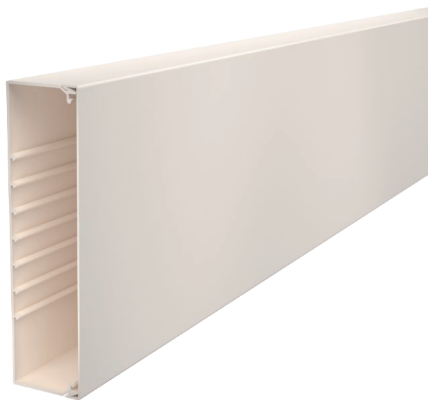
Kanaal en deksel met bodemperforatie.