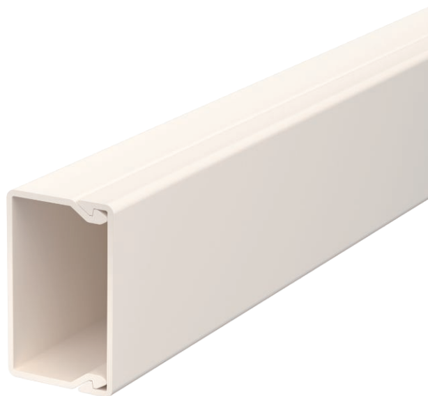
Kanaal en deksel met bodemperforatie.