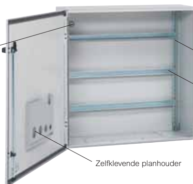
Wandkast Atlantic metaal