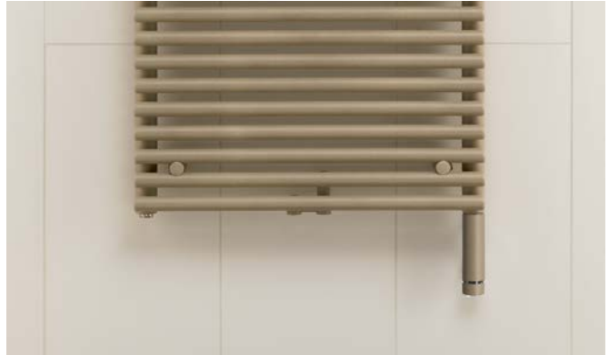
Elektrische uitvoering met ingebouwde elektroverwarmingspatroon WIVAR.