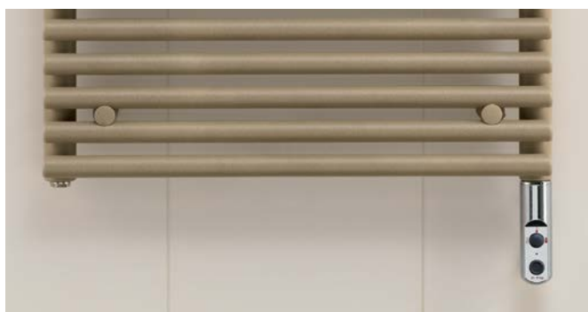
Electric operation version with integrated immersion heater DBM.