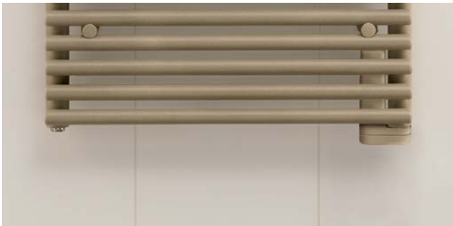
Elektrische uitvoering met ingebouwde elektroverwarmingspatroon.

V20191127, RAD_DAS, BE_nl, wijzigingen voorbehouden