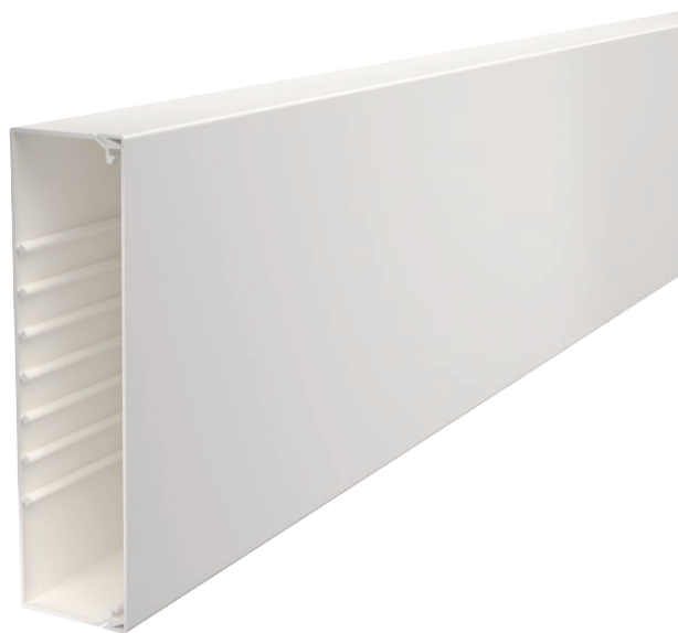
Kanaal en deksel met bodemperforatie.