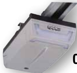
D600 - D1000

Iedere kit bestaat uit een aandrijving + rail met voorgemonteerde ketting + ontvanger/frequentiemodule + 2 x zender XT2 868 + 1 bevestigingsclip voor zender XT