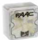
Waarschuwinglamp XL 24 L Artikelcode 410017 Prijs (€)