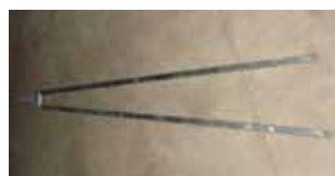
V KIT HEAVY - Versterkte adapter voor buitendraaiende vleugel deur Artikelcode 12204801006 Prijs (€)

Opmerking (*) De aandrijvingen D600-D700HS-D1000 zijn voorzien om een optionele noodbatterij XBAT24 in te bouwen ; (***) Om de externe ontgrendeling te installeren dient U gebruik te maken van de kabelset voor noodontgrendeling. Belangrijk: de stuurprint E600/E700HS/E1000 met nieuwe technologie zijn enkel compatibel met de ontvanger XF868. De aandrijvingen D600-D700HS-D1000 kunnen gebruikt worden met de daarvoor voorziene XL24L waarschuwinglamp.