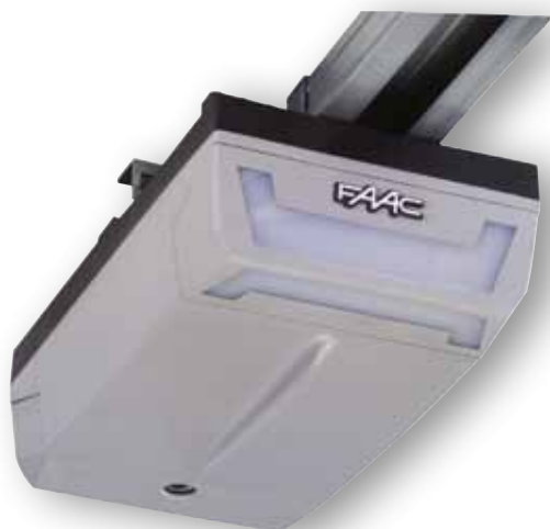
D600 - D1000