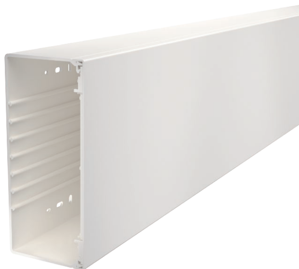
Kanaal en deksel met bodemperforatie.