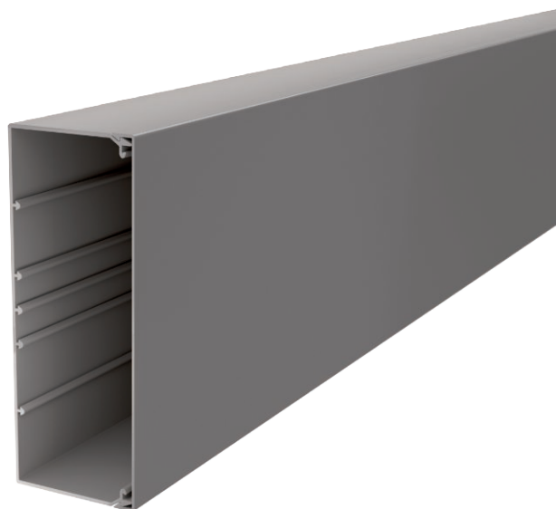
Kanaal en deksel met bodemperforatie.