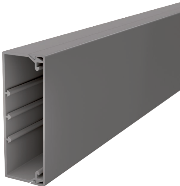
Kanaal en deksel met bodemperforatie.