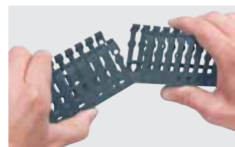
De koker is met de hand opdeelbaar