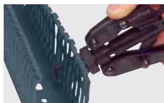
Verwijderen van lamellen met tang ref. 367 10

(1) Aantal stuks van 2m in de verpakking