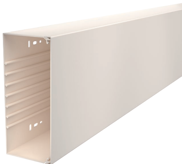
Kanaal en deksel met bodemperforatie.