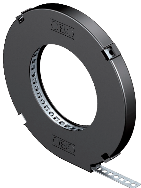
Geperforeerde montageband in handige afrolbox