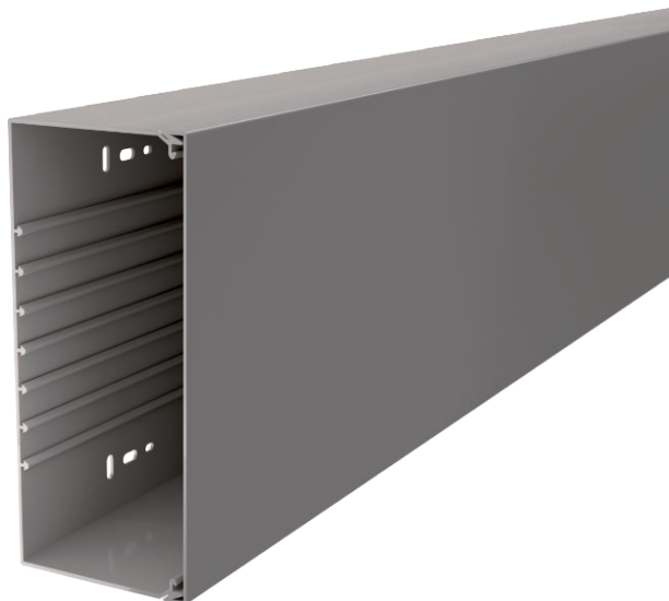
Kanaal en deksel met bodemperforatie.