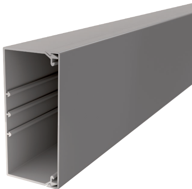
Kanaal en deksel met bodemperforatie.