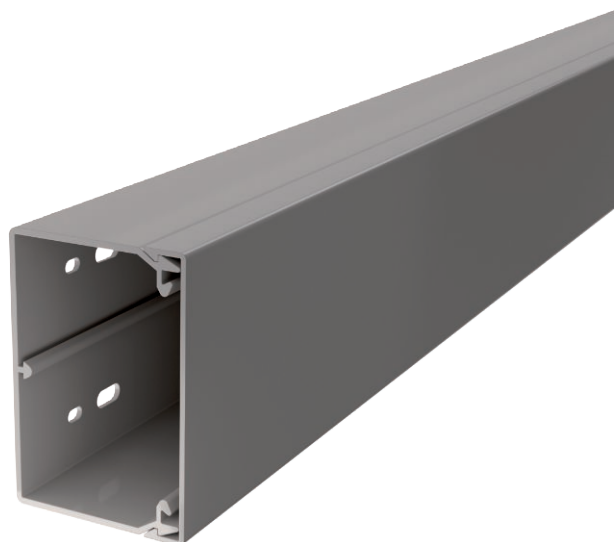
Kanaal en deksel met bodemperforatie.