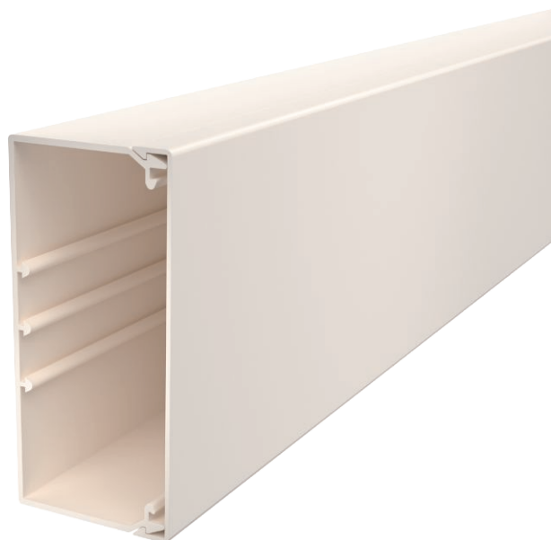
Kanaal en deksel met bodemperforatie.