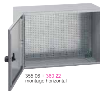
355 06 + 360 22 montage horizontal