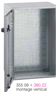
355 08 + 360 22 montage vertical