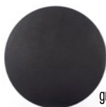
grille noire (option)