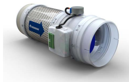
Healthconnector type Maître

ESCLAVE : - l'Esclave est commandé par le Maître - pas de détection