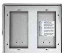
35064... 4 modules