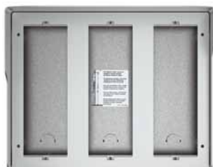
35069... 9 modules