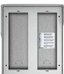
35066... 6 modules