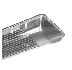
90-01767 Plexi polycarbonate de remplacement 1x18 W