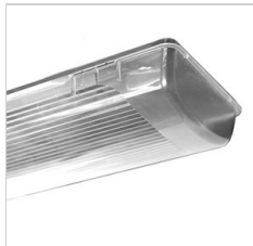
90-01771 Plexi polycarbonate de remplacement 2x36 W