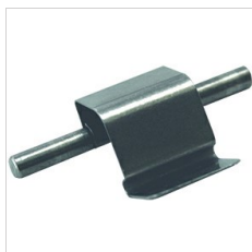
15-00561 Clips imperdables en inox (10)