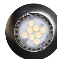
Nickel satiné Nickel satijn