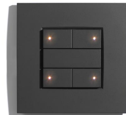
2 Niko® SWC04/122 ANTHRACITE