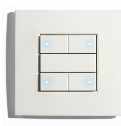
1 Niko® SWC04/101 WHITE