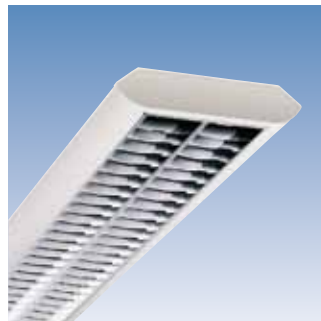
LINEO T5 - 2-lamps

Luminaire apparent composé d'une plaque en acier laqué blanc supportant l'appareillage électronique et les autres composants. Exécution 2 lampes. Destiné à être monté au plafond. Monté avec une optique miroir brillantée à double parabole DPB.