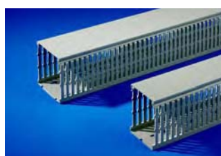
Goulottes de câbles, Réf., voir page 1060.

Dispositif de verrouillage standard à panneton double pouvant être échangé contre un dispositif de verrouillage modèle E (voir page 956) ou contre une poignée Ergoform-S, KS 1490.010 (voir page 953).