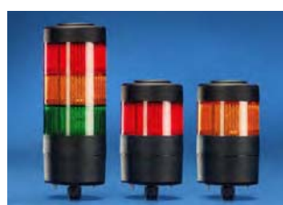
Colonne de signalisation compacte à diodes Avec indice de protection IP 65, Réf., voir page 1125.