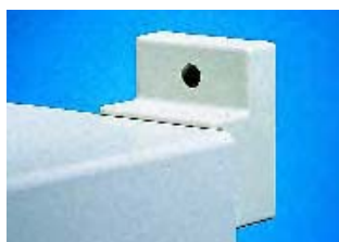
Pattes de fixation murale, Réf., voir page 975.