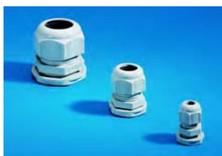
Presse-étoupes en polyamide, Réf., voir page 1054.

Dispositif de verrouillage standard à panneton double pouvant être échangé contre un dispositif de verrouillage modèle E (voir page 956) ou contre un bouton-verrou en matière plastique modèle E (voir page 954).