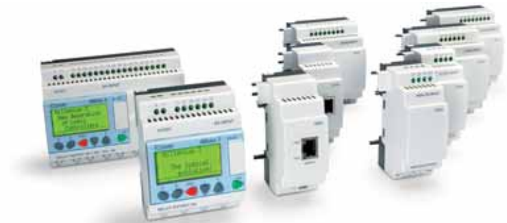
Gamme Millenium 3