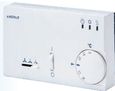
KLR-E 525.52 4p