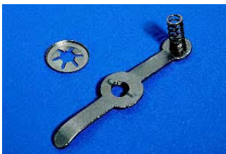
Saillie max. du levier