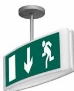
617 91 + 617 46 + 6608 67