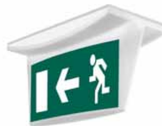
617 82 + 617 36 + 6608 65