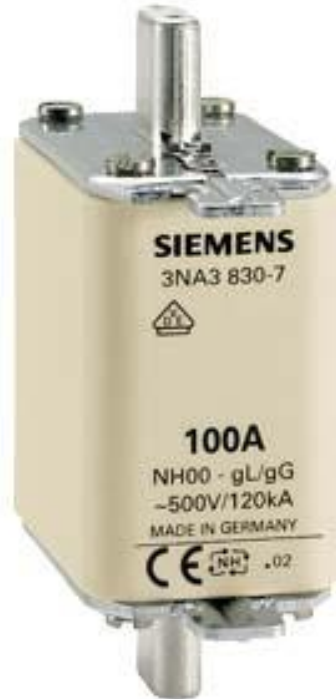
Figure à titre d'exemple

FUSIBLE A COUTEAUX NH GL/GG LANGUETTES ACCROC. NON-ISOLEES T.00, 160A, 500V CA/250V CC