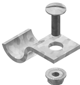
Etrier de fixation pour HDKIE HDBKID25