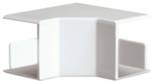
Angle intérieur, LF 40040, blanc paloma