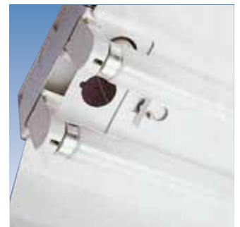
Fixation rapide du réflecteur par écrous quart de tour