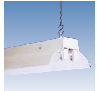
Oeillet pour suspension par chaîne