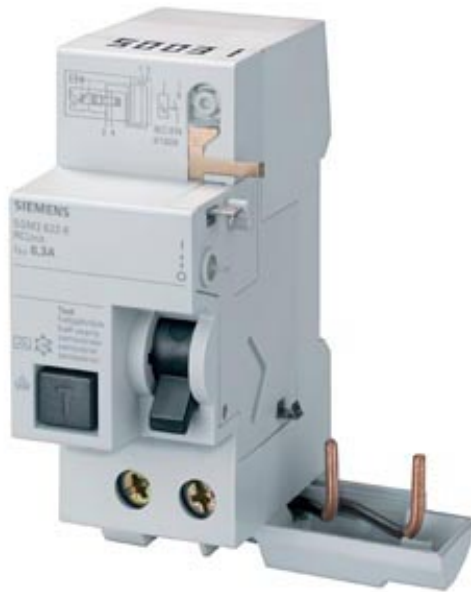
RC UNIT FOR MCB 5SY TYPE A (PSE/SSF), T=70MM 0.3-40A 2POLE IFN 30MA 230V