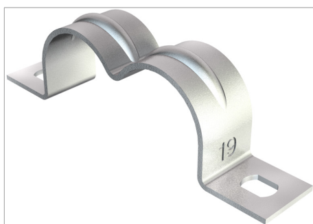
Collier à deux pattes de fixation pour câbles et tubes